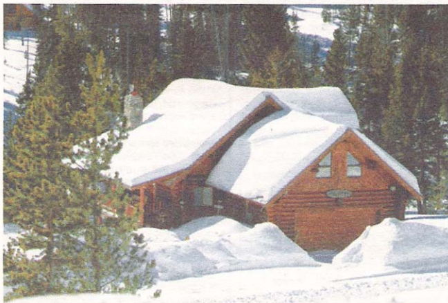
Déjà trois mois d'aventure pour Armelle et Matthieu. Et des dizaines de station de ski...